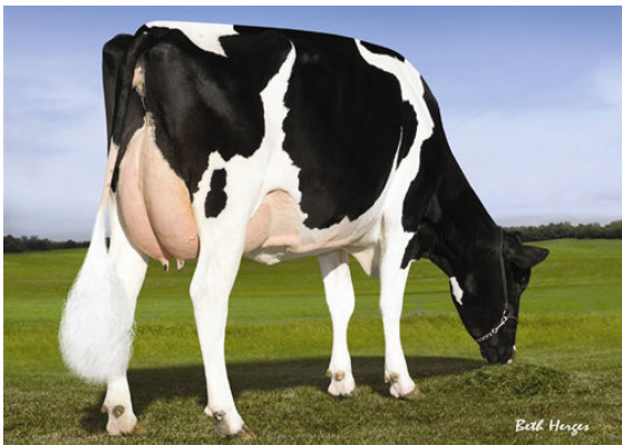
PINE-TREE 2149ROBST 4846 FOURTH DAM