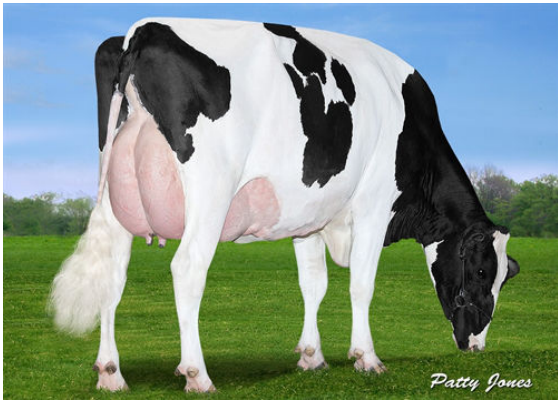
VIEW-HOME MCC FOUND THIRD DAM