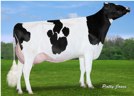
VIEW-HOME MCC FOUND THIRD DAM